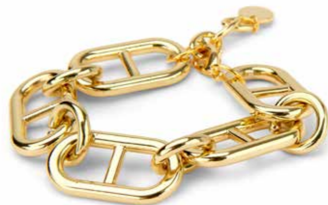
SIERADEN MET SCHAKELDETAIL: ECHTE BLIKVANGERS EN HELEMAAL TRENDY